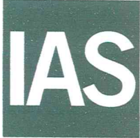
King Cert International Certification Ltd. Director

ACCREDITED Management Systems Certification Body MSCB-196